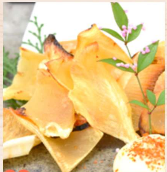
⑤ エイヒレ炙り 880円