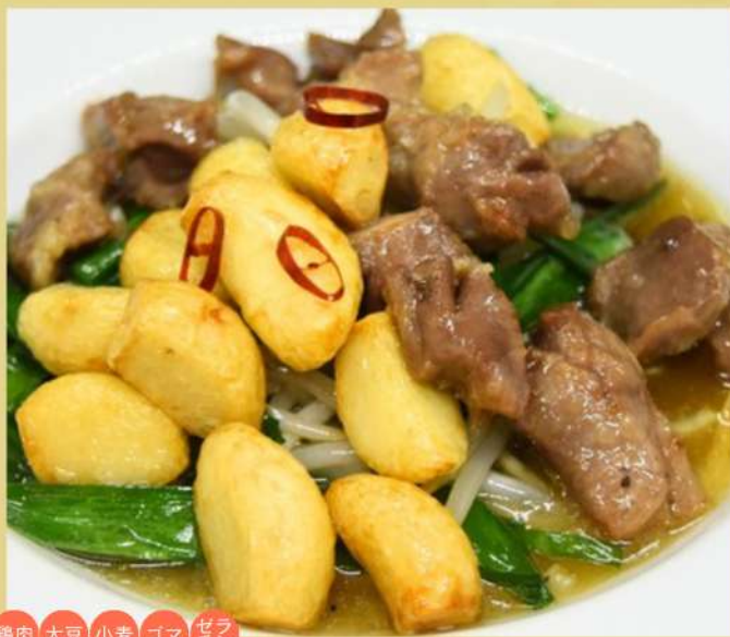
① ゴロゴロはんにくと 砂肝のゆず塩炒め